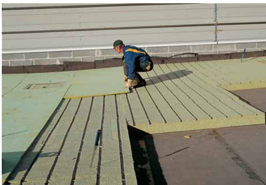
Укладка теплоизоляционных плит PAROC ROB 80t (верхний слой)

С целью решения вопроса эффективного удаления избыточной влаги из совмещенных кровельных конструкций специалистами компании PAROC и была разработана вентилируемая кровельная система PAROC Air. Эта система значительно повышает безопасность и надежность совмещенных кровель. Осушение утеплителя и отвод из него влаги в данном случае происходит благодаря наличию канавок