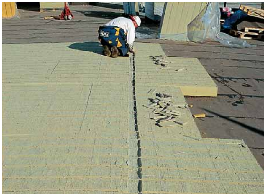
Соединение канавок сборным коллектором

ные нагрузки (снеговые, ветровые и пр.).