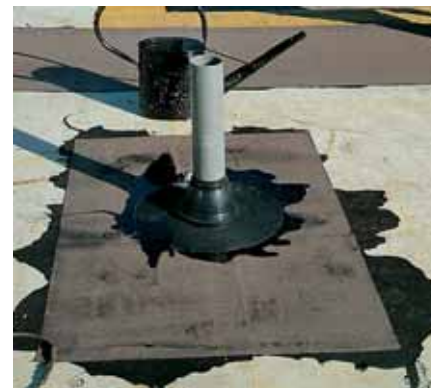
Установка вентиляционного дефлектора

В наружных ограждающих конструкциях, к которым относятся и кровли, материалы крайне редко бывают в абсолютно сухом состоянии. Элементы таких конструкций – если речь не идет о сухом жарком климате – всегда в той или иной степени увлажнены. При этом вода может находиться в материале не только в виде жидкости, но и в виде пара или льда. Естественно, чем выше температура, тем выше ве-