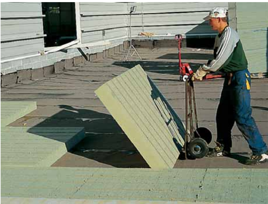
Укладка теплоизоляционных плит с канавками PAROC ROS 40g

Если рассмотреть главный, в контексте настоящей статьи, слой – теплоизоляционный, то он отвечает не только за утепление кровли. Этот слой является также монтажным основанием под гидроизоляционное покрытие и барьером, препятствующим распространению огня. Кроме того, он воспринимает различ-